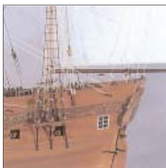
Alberatura Masting. Matùre. Bemastung