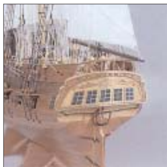
Specchio di poppa. Transom Tableau de poupe. Heckspiegel.